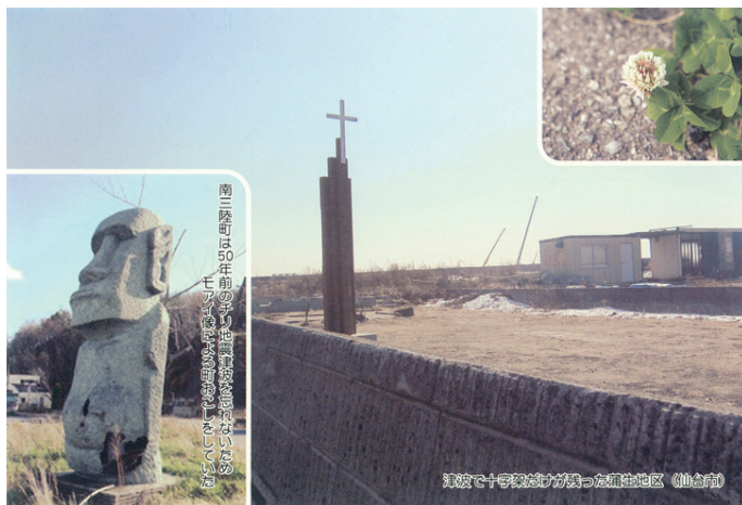
ワイズメンズクラブ国際協会東日本区 北東部の東日本大震災復興支援絵はがき(福島県内版宮城県内版5枚組の1枚)